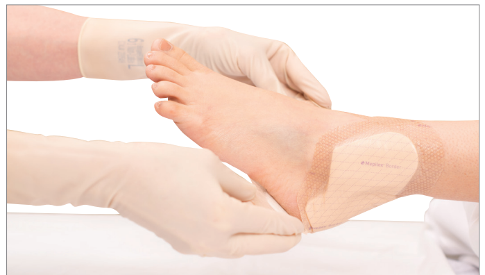
4. Breng het schuim en de rand van het verband terug aan. Zorg dat de flappen met de tabs over de enkelflappen komen