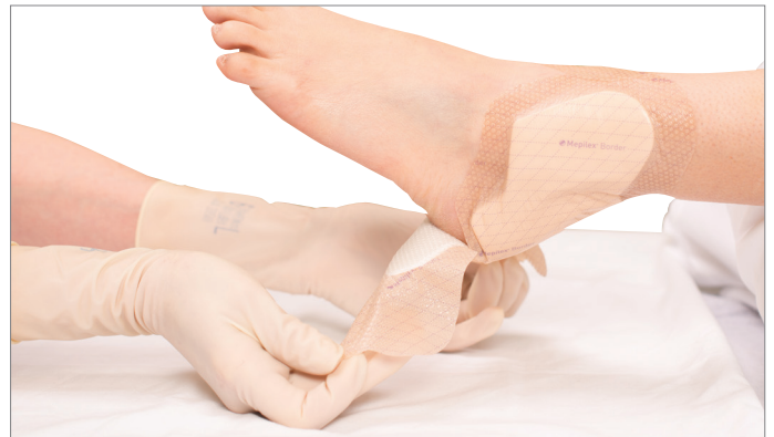
2. Maak het verband verder los van de huid met de tabs, tot de huid blootligt voor controle.