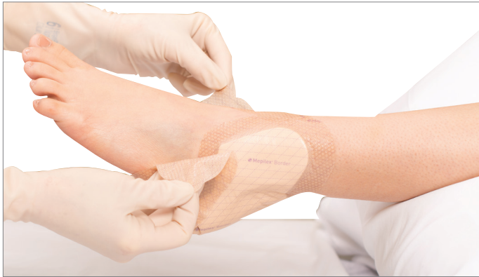
1. Trek zachtjes aan de tabs om het verband van de huid los te maken.