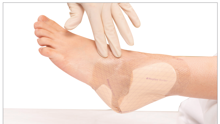
6. Strijk het verband glad, zodat het hele oppervlak tegen de huid komt.