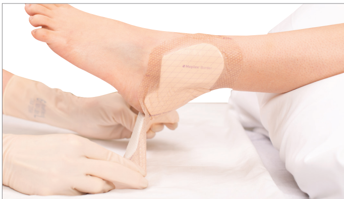
3. Controleer de huid terwijl u het verband op de proximale rand van 'A' houdt (zie afbeelding).