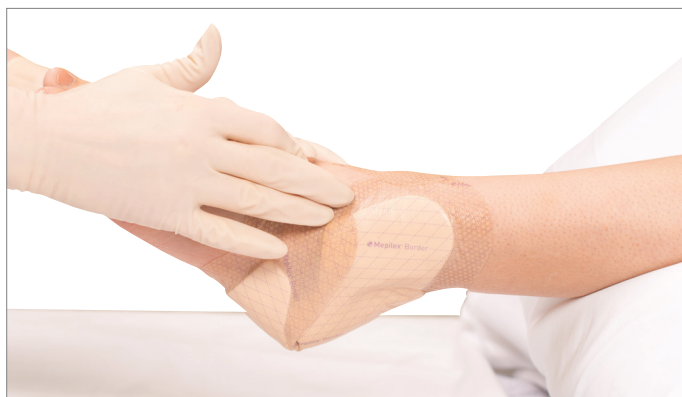
5. Breng het verband terug aan op zijn oorspronkelijke plaats, waarbij u ervoor zorgt dat de rand intact en vlak is.